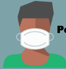
Personne atteinte du COVID-19